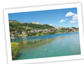
St. Moritz – mondänes Stadtleben St-Moritz – Ambiance chic de la ville