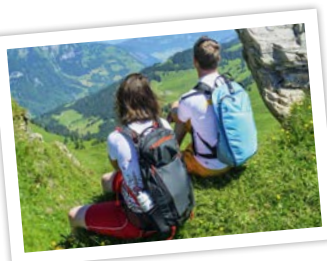
Ganz in der Nähe: Heididorf À proximité: le village de Heidi

Village de Heidi au-dessus de Maienfeld. Thermes Tamina à Bad Ragaz, deux golfs réputés, région de Pizol pour la randonnée et les sports d'hiver, gorges de Tamina. La région est également un véritable paradis pour le parapente, le roller en ligne, l'escalade et le VTT.