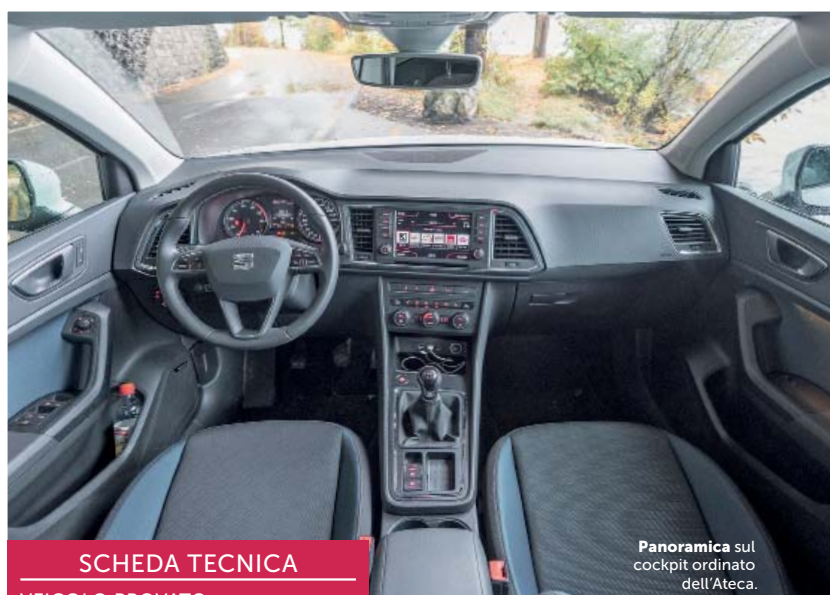
Panoramica sul cockpit ordinato dell'Ateca.

La prima SUV di casa Seat ha le carte in regola per mostrarsi sicura di sé. Con le sue linee sportive e gradevoli attira gli sguardi. Esteticamente questa SUV compatta sa tener testa alla concorrenza. Nel test drive ha affrontato con bravura sia la guida urbana sia i sentieri sterrati nei boschi. Ma come la mettiamo con gli interni? Il primo colpo d'occhio è assolutamente positivo. L'ambiente è gradevole, lo spazio sia davanti sia dietro è generoso e l'abitacolo emana una sensazione di ordine. Una prima impressione confermata dai molti sistemi di assistenza opzionali quali il regolatore adattivo o il mantenimento di corsia. Seat ha fatto