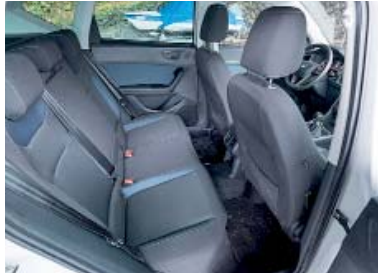
Sedili posteriori ribaltabili singolarmente.