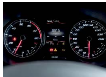
Sulla strumentazione si leggono le principali informazioni di marcia.

Gli elementi dell'auto, dal motore al cambio fino al telaio, sono ben armonizzati ed infondono una gradevole sensazione di sicurezza. Vi contribuiscono anche i sedili comodi e ben rifiniti. Inoltre i freni sono molto performanti e permettono alla SUV di passare da 100 km/h all'arresto completo già dopo 33,4 m. Il regolatore di velocità adattivo con frenata d'emergenza permette a sua volta