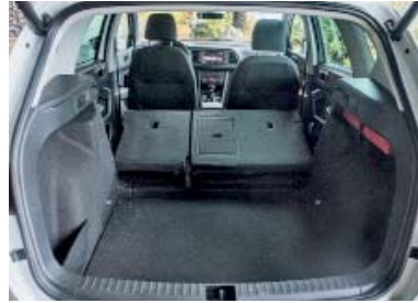
1604 litri: il volume massimo del bagagliaio.