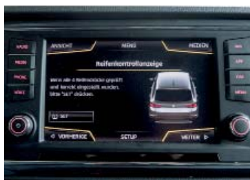
Intuitivo lo schermo tattile dalle grandi dimensioni.

Il modello che abbiamo avuto in prova è dotato di trazione anteriore, ed è mosso da un motore a benzina turbocompresso che eroga 150 CV, appena sufficienti per una SUV da 1,4 tonnellate. La Seat Ateca TSI Style (4x2) sfodera peraltro una dinamica di guida piuttosto modesta e ci vogliono ad esempio 8,7 secondi per raggiungere i 100 km/h. Anche le riprese della SUV sono relativamente fiacche. Chi desidera viaggiare con una certa dose di brio, deve mettere spesso mano al cambio comunque ben calibrato. Tuttavia l'Ateca, con la quale non ci si avventura spesso fuori strada malgrado la buona altezza da terra, in autostrada si comporta bene e non disdegna i viaggi lunghi, tutt'al contrario. Nell'insieme si tratta di una SUV polivalente destinata all'uso quotidiano che si presta a svariate esigenze, anche grazie alle sospen-