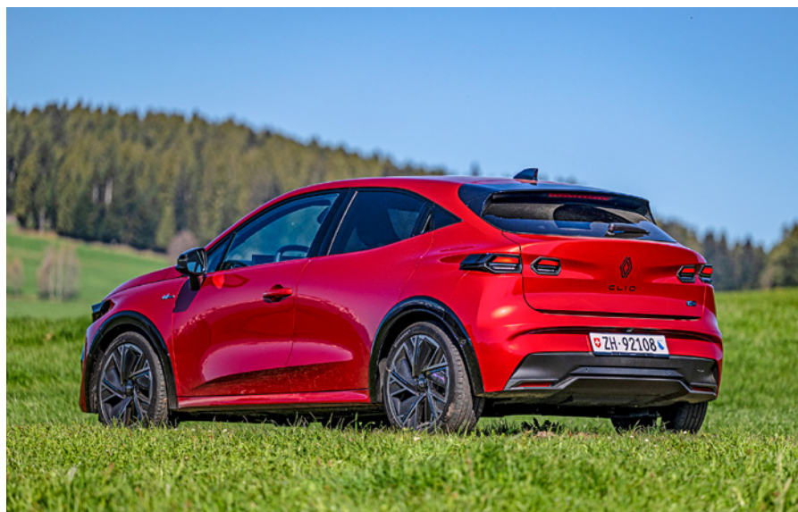
Grintosa anche vista da dietro. Il bagagliaio è più piccolo nella versione ibrida.

Per il resto, la Clio suscita grande soddisfazione. Il grande schermo del conducente e quello centrale, che si integrano perfettamente, riproducono con una risoluzione nitidissima le moderne opzioni del menu. Si rinuncia in gran parte alla vernice lucida, assai sporchevole. Per le impostazioni del climatizzatore è disponibile una barra di comandi ben fatta. Come abituale per Renault, gli assistenti di monitoraggio e allarme, oltre a quelli obbligatori, possono essere disattivati e riattivati direttamente tramite pulsante. C'è un pulsante anche per le modalità di guida. Tuttavia, grazie alla modalità «Smart eco», le selezioni non sarebbero quasi più necessarie, poiché la propulsione reagisce molto rapidamente ai comandi dell'acceleratore e passa per un certo tempo da sola in modalità Sport. E non è solo il pedale del gas ad attivare le impostazioni sportive: il sistema interpreta come intenzione sportiva anche i movimenti rapidi dello sterzo. Davvero intelligente. o