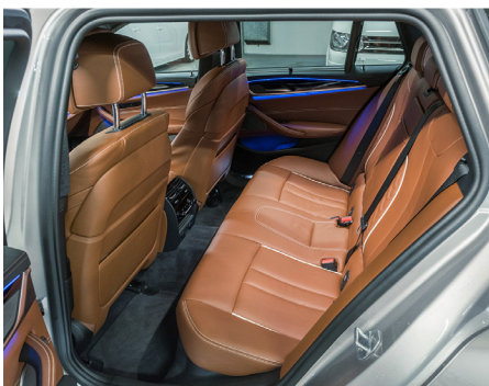
Bequem Die gut konturierte Rücksitzbank