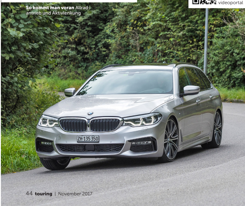
44 touring | November 2017