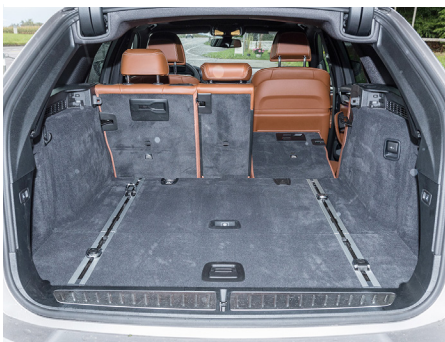
Der Kofferraum Gut konfiguriert, aber nicht riesig