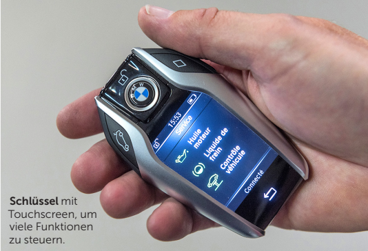
Schlüssel mit Touchscreen, um viele Funktionen zu steuern.