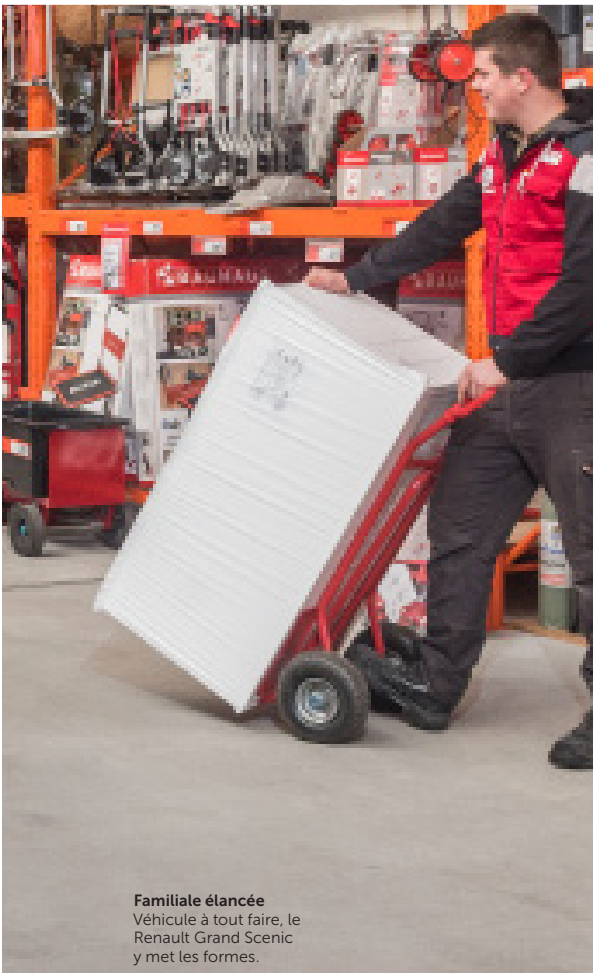
Familiale élanée Véhicule à tout faire, le Renault Grand Scenic y met les formes.