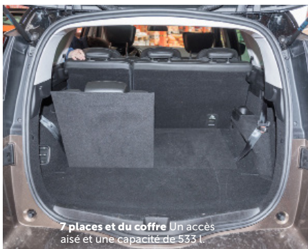
7 places et du coffre Un accès aisé et une capacité de 533 l.