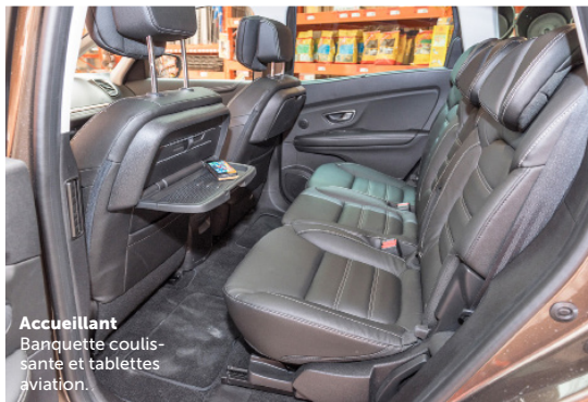
Accueillant Banquette coulissante et tablettes aviation.