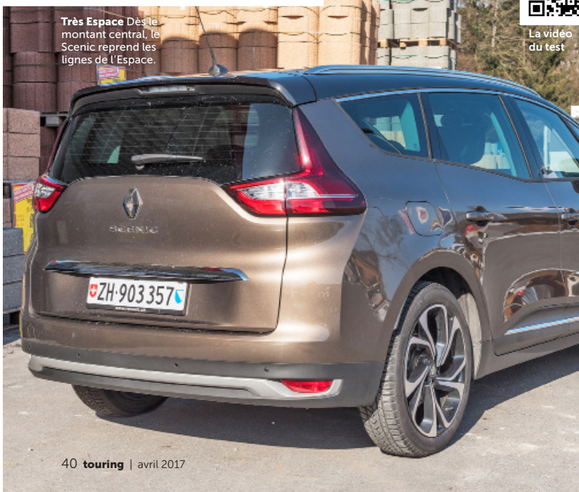
Très Espace Dès le montant central, le Scenic reprend les lignes de l'Espace.