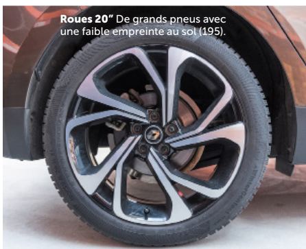
Roues 20" De grands pneus avec une faible empreinte au sol (195).