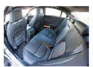
A l'alse à deux Bien qu'un peu étriqué, l'espace est suffisant sur la banquette aux larges assises.

Quoi qu'il en soit, la Jaguar XE est une parfaite routière. A l'avant, les sièges sport cuir (1140 fr.), à la fois enveloppants et confortables, incitent à avaler des kilomètres, ce d'autant que le niveau sonore est faible. Comme ses congénères de la catégorie, cette berline réserve une habitabilité moyenne sur la banquette arrière. Les dossiers avant évidés assurent toutefois un espace aux jambes comvenable, tandis que les assiese généreusement dimensionnées promettent un voyage dans le confort.