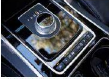
Commande de bolte Une molette pratique assortie de 4 paramétrages à choix.