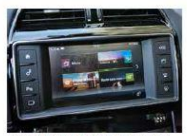
Ecran 8 pouces intuitif On accède à la plupart des fonctions du bout des doiots.