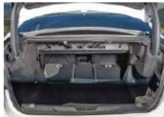
Bagagliaio da berlina Due ganci permettono di abbassare i 3 elementi della panca posteriore.