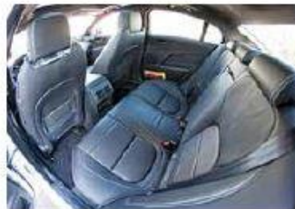
Comoda per due Anche se un po' striminzito, lo spazio è sufficiente sulla panca dall'ampia seduta.

L'elegante britannica è anche al passo coi tempi. I sistemi di assistenza (Head up display, regolatore adattativo e fari intelligenti) funzionano in modo soddisfacente. Non si può dire altrettanto per il sistema di navigazione, disturbato talvolta da interruzioni. Rimane comunque apprezzato lo stile molto british di questa seducente Jaguar XE.