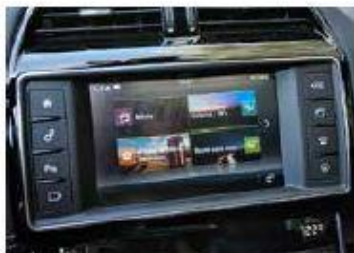
Schermo 8" intuitivo Basta toccare con il dito per accedere alla maggior parte delle funzioni.