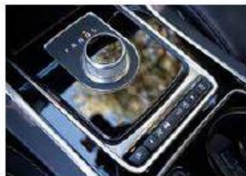
Comando del cambio Una pratica rotella con 4 parametraggi a scelta.