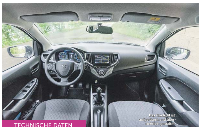
Das Cockpit ist aufgeräumt und übersichtlich gestaltet.

E r kann getrost als freches und sparsames Kerlchen bezeichnet werden. Die Rede ist vom neu aufgelegten Suzuki Baleno. Die von uns getestete Version Baleno 1.2 SHVS Compact Top wird in Indien gefertigt, kommt ohne Extravaganzen aus, weil seine wahren Werte unter der Karosserie stecken. Darunter verbergen sich einiges an Technologie und ein erstaunlich geräumiger Innenraum. Ein cleverer Wurf seitens Suzuki, der die Konkurrenz aufhorchen lassen muss. Der elegante Kompaktwagen ist bloss knapp vier Meter lang und 1,7 Meter breit. Somit ist er nur ein paar Zentimeter kürzer als andere Kleinwagen. Bei diesen Massen könnte man meinen, dass