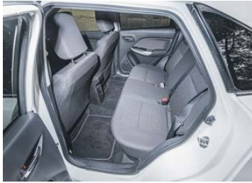
Die Beinfreiheit im Fond ist erstaunlich grosszügig.