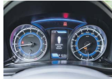
Zwischen den Hauptinstrumenten zeigt das kleine Display diverse Fahrdaten an.

Bei der serienmässigen Ausstattung setzt Suzuki im Kompaktwagensegment neue Massstäbe. Beim Komfort gehören