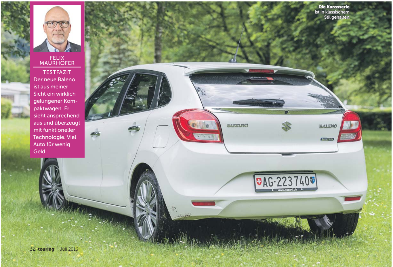
Die Karosserie ist in klassischem Stil gehalten.

So ausgerüstet hat Suzuki mit dem Baleno einen Kompaktwagen auf dem Markt, dessen Preis-Leistungs-Verhältnis sehr gut ist. Für etwas über 20 000 Franken bekommt man ein top-ausgerüstetes Auto, welches mit der Konkurrenz locker mithalten kann und mit modernster Technik ausgerüstet ist. .