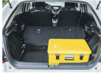
Die hohe Ladekante des Kofferraums behindert das Beladen.