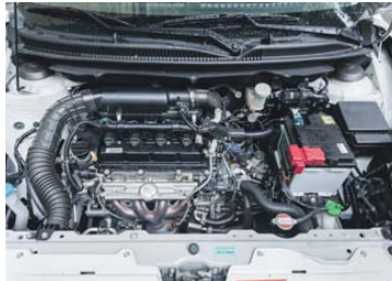
Der 1,2-l-Benziner erhält beim Anfahren und Beschleunigen Unterstützung vom E-Motor.

Natürlich ist der Baleno – auf Deutsch Blitz – mit seinem 90 PS starken 1,2-Liter-Benziner kein ausgereiftes Sprintwunder. Doch Obacht, das Hybrid-System namens SHVS hilft beim Beschleunigen und mit dem niedrigen Gewicht von nur 1015 Kilogramm kommt der Kleine gut vom Fleck. Zudem schnurrt der Vierzylindermotor recht kultiviert. Nun, das Hybridsystem nutzt einen integrierten Startergenerator, der den Verbrennungsmotor unterstützt und durch regeneratives Bremsen Strom erzeugt. Auf diese Weise werden beim Losfahren und Beschleunigen zusätzliche 50 Nm Schub zugeschaltet. Das wirkt sich positiv auf den geringen Verbrauch von 4,9 l auf 100 Kilometer aus. Auch im Stadtverkehr zeigt dieses Antriebssystem seine Vorteile, indem die