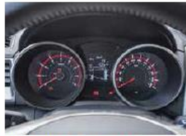
Alles, was nötig ist Der Tivoli ist aufs Wesentliche reduziert.