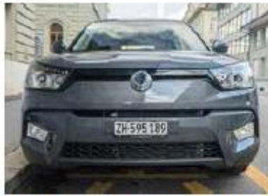
Stadt-SUV Man sitzt erhöht, fühlt sich sicher und fährt doch wendig.