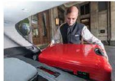
Noch mehr Platz Mit umgeklappten Sitzen passen sogar 1115 Liter rein.

Allrad stehen schon bei den Händlern. Ab Herbst gibt es auch eine 115-PS-Diesel-Version, die ebenfalls mit 4x4-Antrieb erhältlich ist. Mit einer Bodenfreiheit von 16,7 cm eignet er sich nicht wirklich als Offroader. Dafür wartet er mit einer dreistufigen Servolenkung auf, da SUV auch oft in der Stadt gefahren werden.