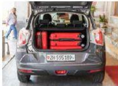
Viel Fassungsvermögen Der Kofferraum fasst stattliche 423 Liter.

Bemerkenswert ist, dass man bei SsangYong die Bezeichnung SUV im Gegensatz zu manchen europäischen Herstellern ernst nimmt: Benzinier mit