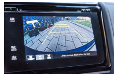
Gute Auflösung Die Rückfahrkamera erweist sich als sehr nützlich.