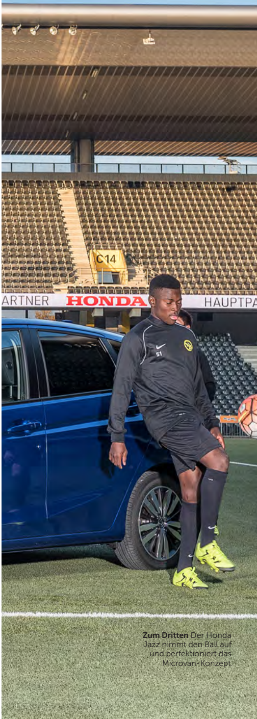
Zum Dritten Der Honda Jazz nimmt den Ball auf und perfektioniert das Microvan-Konzept

F ür den neuen Jazz hatte Honda die gute Idee, den einstigen Stadtfliitzer in einen Microvan zu verwandeln. Auf einer neuen Plattform und um 9,5 Zentimeter verlängert, vollzieht die 3. Generation des Jazz diese sinnvolle Kehrtwende, die sich ja bereits beim Vormodell abgezeichnet hat. Tatsächlich gibt es wenige Autos, die bei derart kleinen Abmessungen (Länge 4,01 Meter) einen ähnlich grossen Innenraum aufweisen können. Ohne dass die raffinierte Variabilität gross verändert wurde, hat der Jazz in der neuen Ausführung durch ein modernes Audio- und Informa-