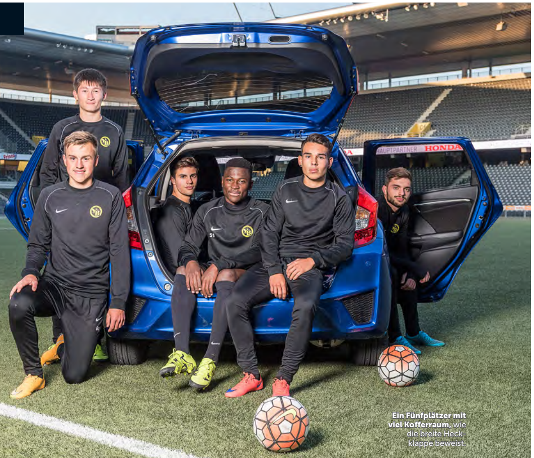
Ein Fünfplätzer mit viel Kofferraum, wie die breite Heckklappe beweist.