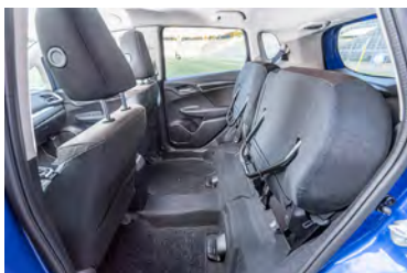
«Magic Seats» Mit zwei Handgriffen schafft man hier viel Raum.

4 Gesamtkosten auf 180 000 km bei 15 000 km/Jahr 5 1.0 SCTi 125 PS