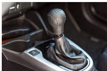
Knackig Der Schaltknopf des Getriebes mit kurzen Wegen ist etwas tief angeordnet.

stimmt. Dem Fahrer geht ein Notbremsignal zur Hand, das gut funktioniert. Ab und zu ein falscher Alarm gehört bei solchen Systemen ja fast schon dazu. Wertvoll sind ebenfalls der Spurhalteassistent und die Verkehrszeichenerkennung. Der Honda Jazz kann sich punkto umfangreicher Ausstattung trotz seines günstigen Preises sehen lassen. Die getestete Version Elegance verfügt zusätzlich über ein taktiles Multimedia-Gerät und eine wirksame Rückfahrkamera. Aber auch die beiden anderen Versionen sind gut ausgerüstet. Hoffen wir, dass der jetzt ausgereifte Microvan eines Tages wie sein Vorgänger in einer Hybrid-Version herauskommen wird.