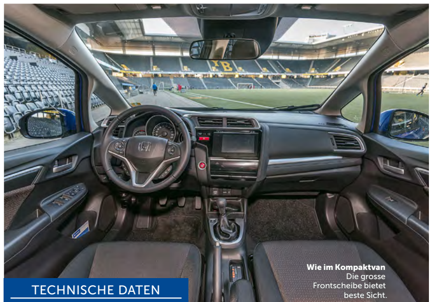
Wie im Kompaktvan Die grosse Frontscheibe bietet beste Sicht.