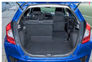
Tolle Ladefläche Der Kofferraum braucht mit seinen 354 l die Konkurrenz nicht zu fürchten.