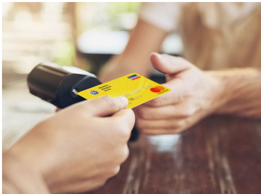
Die neue TCS-Mitgliedskarte für Sie: zum Sparen und Zahlen.