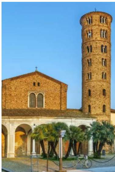
Visite de la Basilique Saint Apollinaire

Après le buffet du déjeuner nous partons en car pour Ravenne.