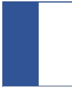
1/2 page verticale 100 x 292 mm