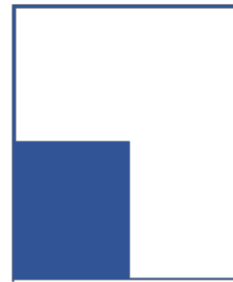
1/4 page verticale 102.5 x 146