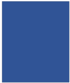
1 page 205 x 292