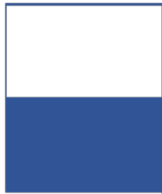
1/2 page horizontale 205 x 146