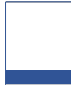
1/8 page horizontale 205 x 35 ou bandeau bas de page UNE 205 x 30 mm