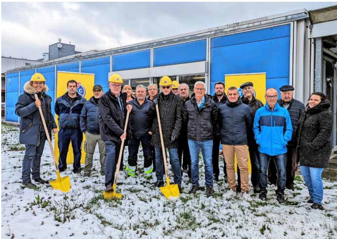
Die Freude über den Baustart ist bei allen Beteiligten gross.

Nach der Fertigstellung des Prüfzentrums im Herbst 2024 wird der neue Waschpark für Velos, Motorräder, Camper, Wohnmobile, Autos und Anhänger mit zwei Portalwaschanlagen sowie Lanzenwaschsystemen und Staubsaugerplätzen realisiert – eine weitere Bereicherung des Angebots für die TCS-Mitglieder.