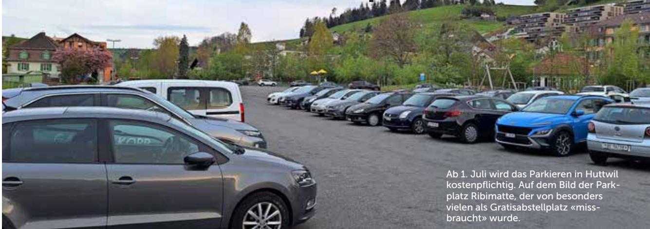
Ab 1. Juli wird das Parkieren in Huttwil kostenpflichtig. Auf dem Bild der Parkplatz Ribimatte, der von besonders vielen als Gratisabstellplatz «missbraucht» wurde.