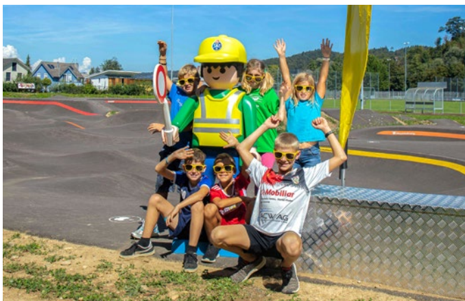
Auch die Jüngsten sind mit vollem Elan auf dem Pumptrack unterwegs