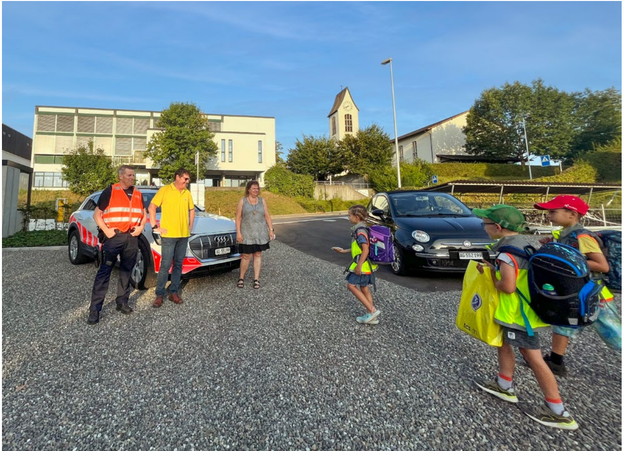
Aktion «Schulbeginn Verkehrskontrolle Schüler» in Aristau