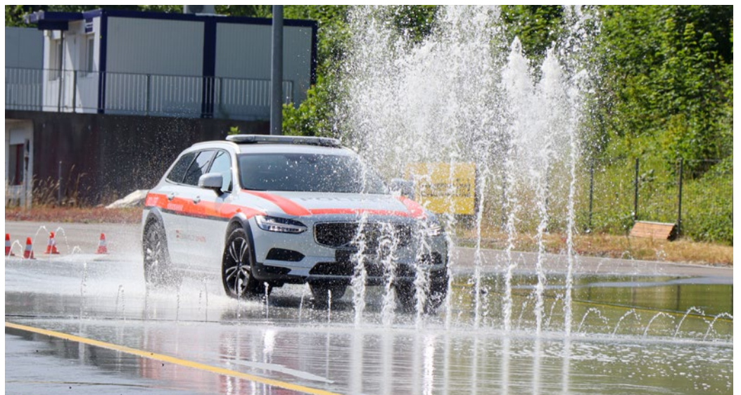
Die Polizei kommt am Weiterbildungskurs auf der Fahranlage im TCS Fahrzentrum Frick ins Schleudern