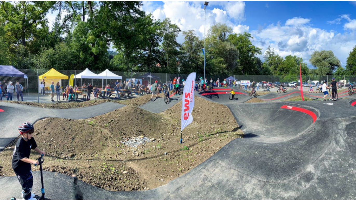
Pumptracks, Verkehrssicherheit spielerisch erleben – der neue Pumptrack zieht Gross und Klein in Scharen an