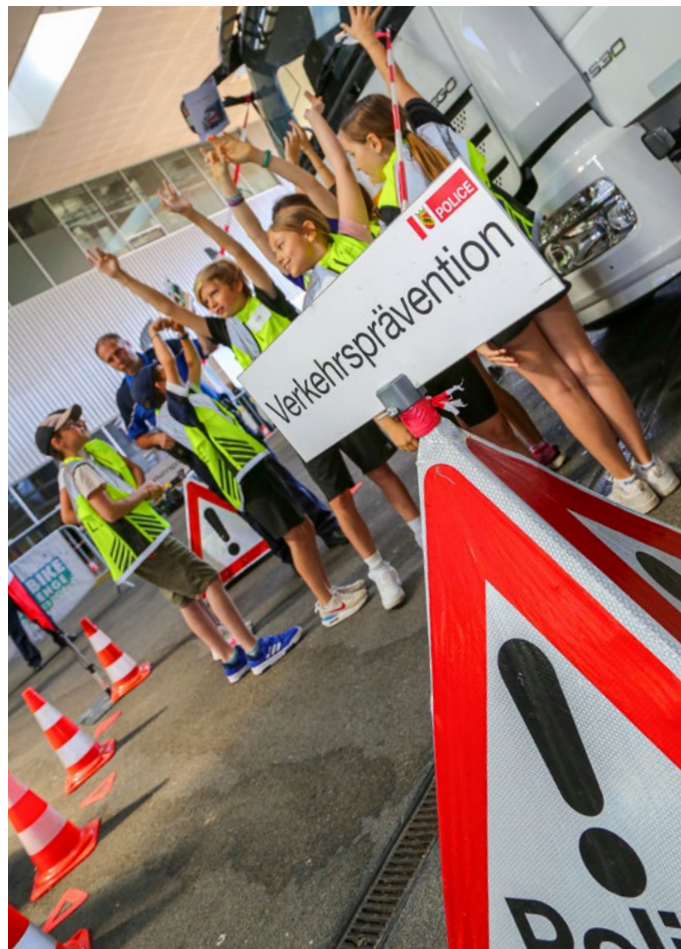
Aargauer Kinder räumen die ersten drei Plätze bei der Kids-Bike-Challenge in Biel ab