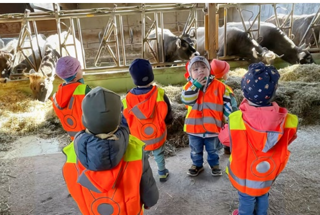
Die TCS Kindergartenwesten werden auch in der Freizeit rege genutzt