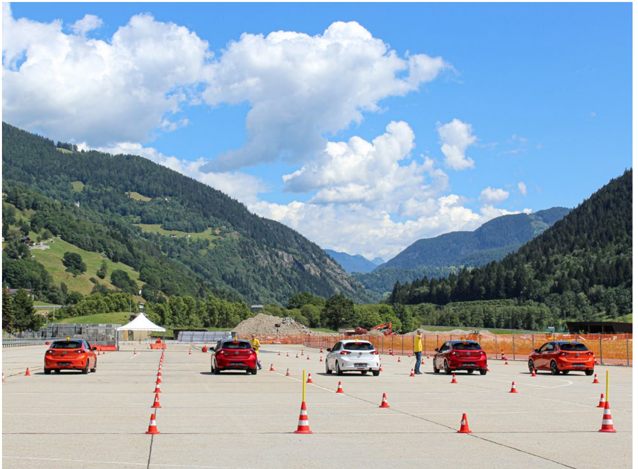
TCS Instruktoren im Einsatz