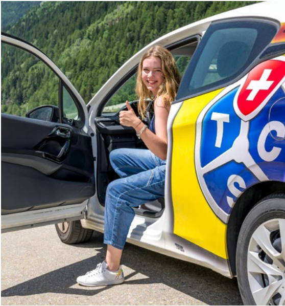
Spass im TCS Drive Camp