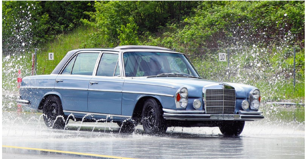
Auch Oldtimer-Besitzer nutzen das Fahrtrainingsangebot in Frick