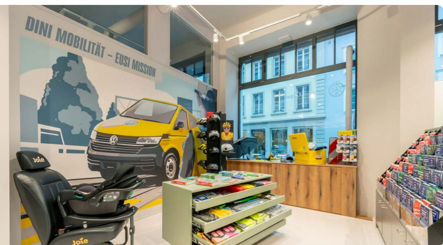
Zentral, modern und den Kundenbedürfnissen angepasst – die neue TCS Kontaktstelle Aarau

Das Jahr 2025 stand ganz im Zeichen der konsequenten Weiterverfolgung der Strategie 2024 bis 2028. Die strategischen Leitplanken dienten als wichtige Orientierung bei sämtlichen Entscheidungen, insbesondere im Hinblick auf die Neuausrichtung der Dienstleistungen, die Optimierung der Infrastruktur sowie die langfristige Sicherstellung einer effizienten und mitgliederorientierten Verbandsführung.