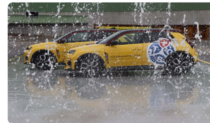
Die neuen Mietfahrzeuge im Fahrzentrum Frick sorgen für zusätzliche Sichtbarkeit des TCS

Aufgrund der kontinuierlich sinkenden Nachfrage nach freiwilligen Fahrzeugprüfungen wurde das Technische Zentrum in Birr per Ende Oktober 2025 geschlossen. Dieser Schritt war das Resultat einer sorgfältigen Analyse und fügt sich in die übergeordnete Strategie ein, Ressourcen gezielt und nachhaltig einzusetzen. Ralph Engler, langjähriger Leiter Technisches Zentrum, wird der Sektion bis zu seiner Pension im Sommer 2026 erhalten bleiben und übernimmt andere Aufgaben.