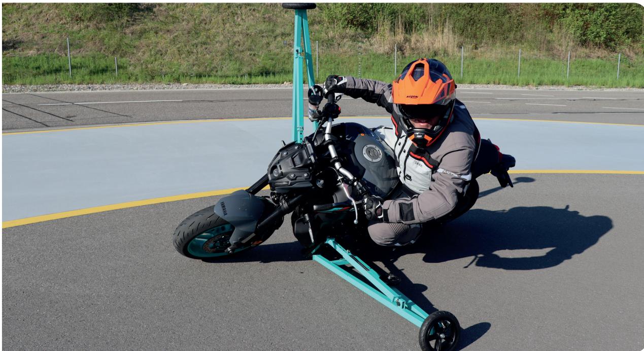
Die Schräglage mit dem Motorrad macht viel Spass — sofern man geübt ist