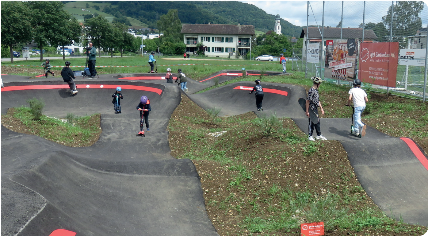
Pumptracks – Verkehrssicherheit spielerisch erleben – der neue Pumptrack in Frick zieht Gross und Klein in Scharen an