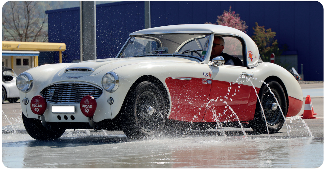
Fahrtrainings mit dem Oldtimer sind auch immer ein Austausch unter Gleichgesinnten