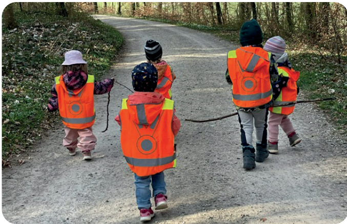
Gut sichtbar unterwegs – Kinder in TCS-Westen