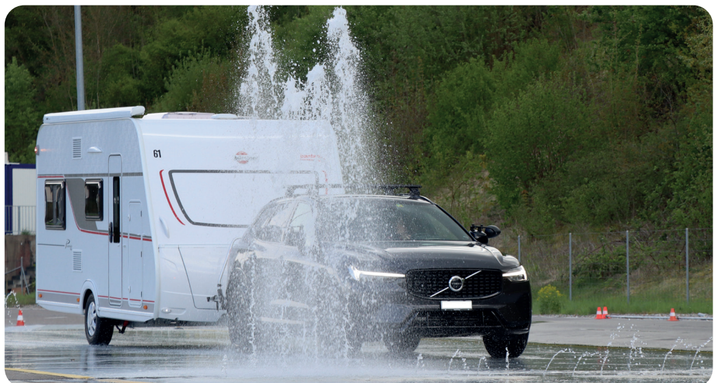
Auch mit dem Wohnwagen muss man in jeder Situation richtig reagieren können