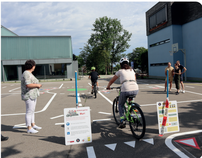
Verkehrsgarten «Badweiher» in Muri