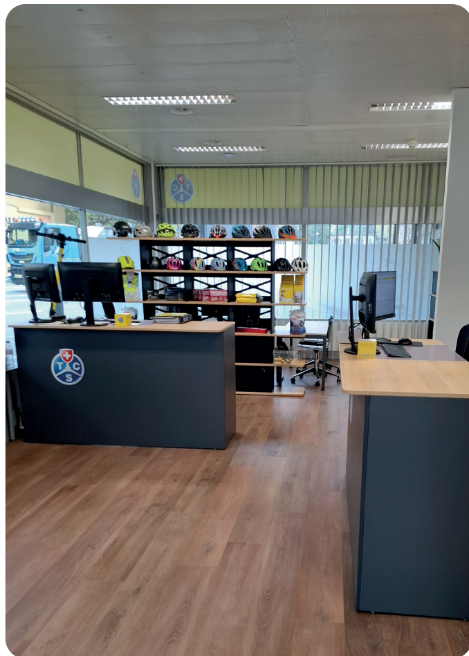
Der Verkaufsraum in der neuen TCS-Kontaktstelle in Baden