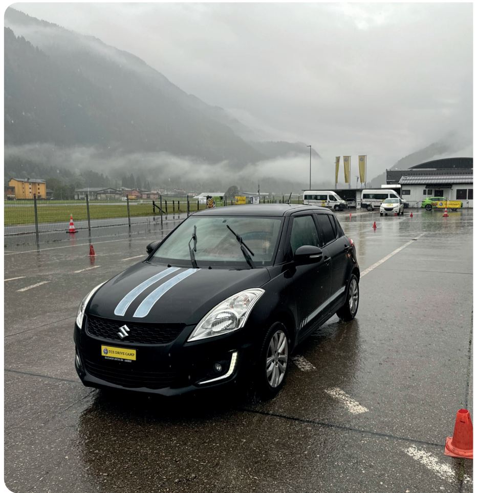
Auch im Tessiner Regen üben sich die Teilnehmenden des TCS Drive Camps