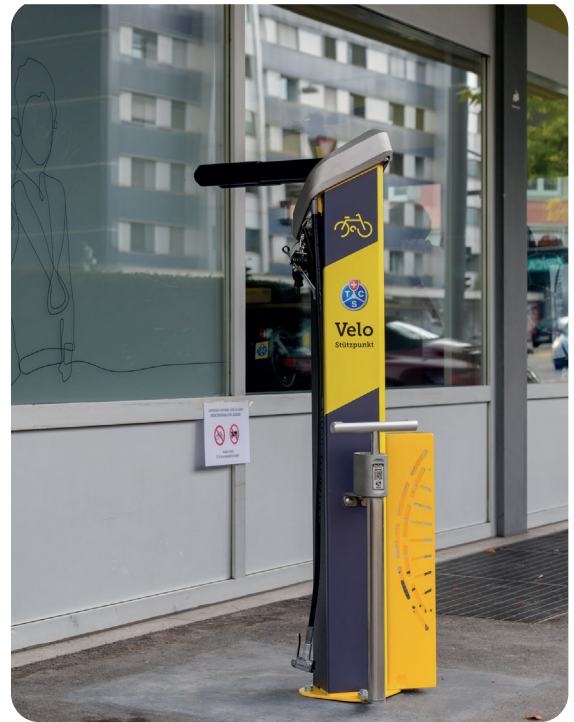
TCS Velo-Reparaturstation in Baden