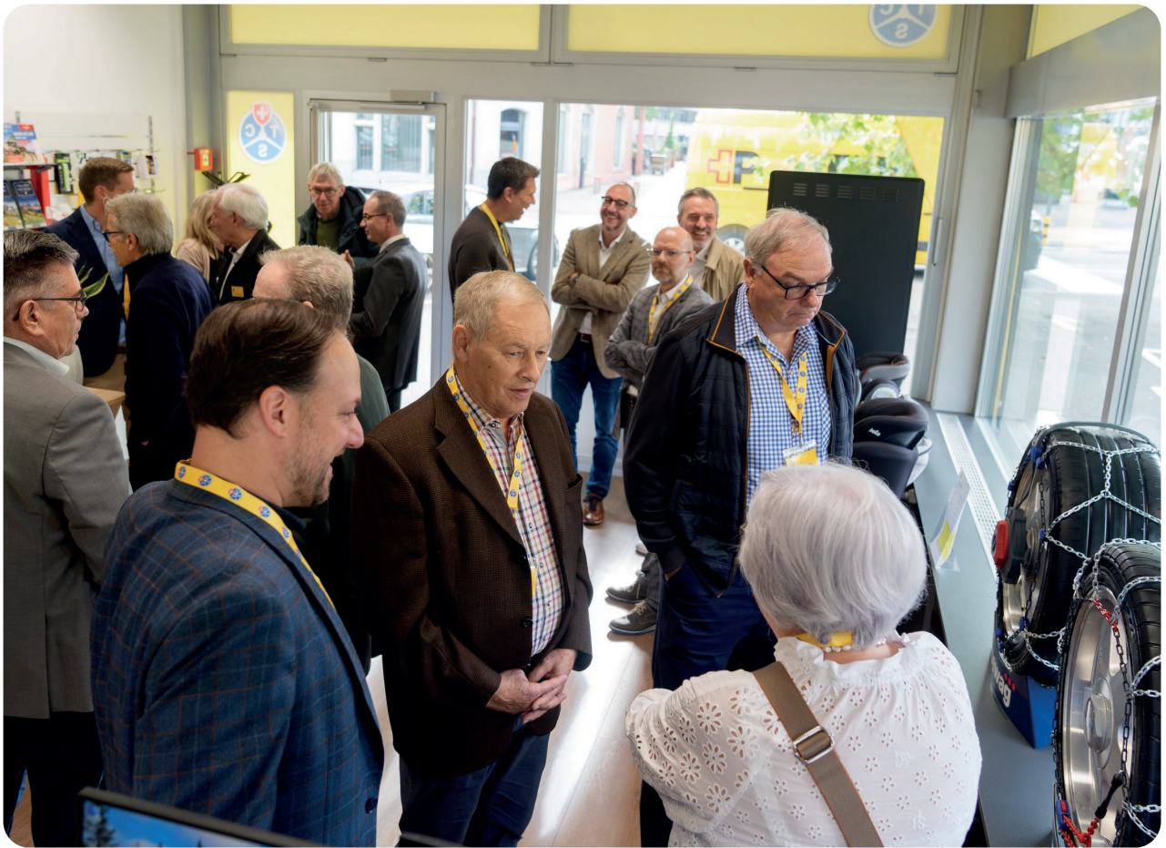
Eröffnungsanlass in der neuen TCS-Kontaktstelle in Baden