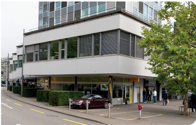
Aussenansicht der neuen TCS-Kontaktstelle in Baden