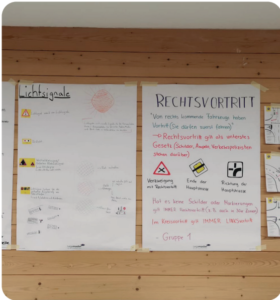
Theoriezusammenfassung im TCS Drive Camp