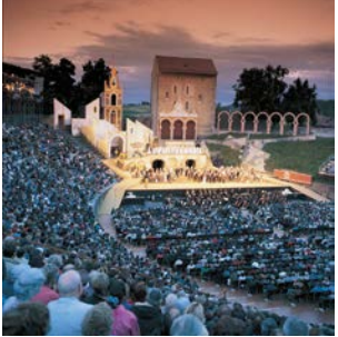
Avenches et Morat: Cités historiques Avenches und Murten: historische Städte

Ne manquez pas la cité médiévale de Morat et sa promenade au bord du lac très prisée, la petite ville d'Avenches établie il y