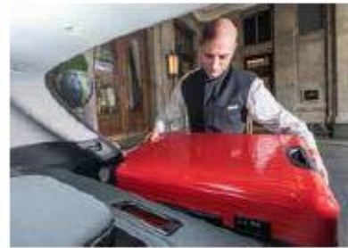
Modularité Sièges rabattus, le volume disponible atteint 1115 litres.

À l'inverse de beaucoup de constructeurs européens, SsangYong prend l'appellation SUV au sérieux. Le modèle essence à traction intégrale est d'ores et déjà disponible chez les concessionnaires. Et une version diesel – également 4x4 – suivra dès l'automne. La garde au sol de 16,7 cm ne se prête toutefois pas vraiment aux aventures hors pistes. En revanche, l'assistance de direction est réglable sur trois niveaux.