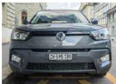
SUV urbain Position surélevée, sentiment de sécurité et maniabilité.