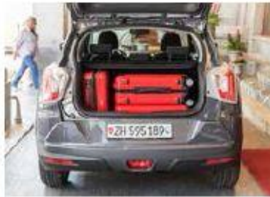
De la place pour les bagages Le coffre présente une respectable capacité de 423 litres.

On est surpris de ce que ce véhicule offre. Ce d'autant que le prix fait davantage penser à un produit low cost. La ligne d'équipements intermédiaire Quartz de l'exemplaire testé propose ainsi sept airbags (dont l'un pour les genoux du conducteur), la climatisation, le volant et les sièges chauffants (option), le streaming audio avec installation mains libres, l'éclairage automatique et la caméra de recul. Les trois lignes d'équipement donnent droit aux feux de détresse s'allumant en cas de freinage d'urgence, à l'ESP et à l'aide au démarrage en côte. On regrette que l'alarme d'angle mort ne soit même pas disponible en option car, à droite notamment, le très large montant arrière limite la visibilité.