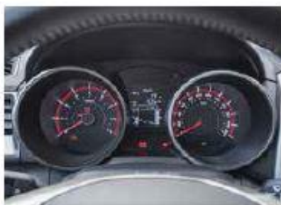
Tout ce qu'il faut Le Tivoli est un véhicule offrant l'essentiel.