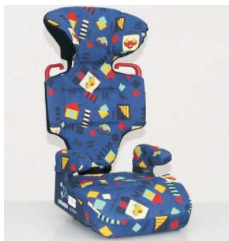
Britax Römer Zoom /Comfy, ca. CHF 195.-