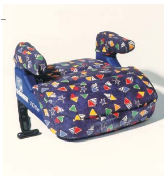
Britax Römer Zoom, ca. CHF 120.-