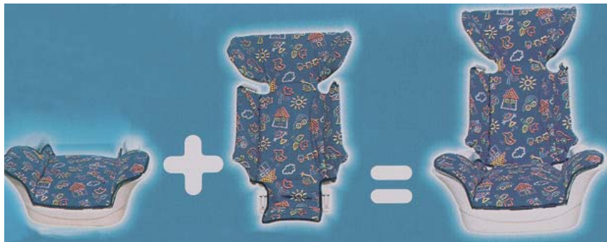
Kiddy Mega Base, ca. CHF 169.-