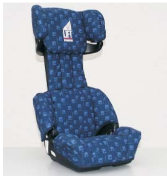
Concord Image2 / Lift, ca. CHF 155.-