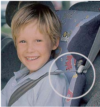
Esempio di geometria ottimale della cintura nella zona del collo