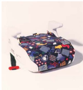
Britax Römer Star Riser 2, ca. CHF 85.-