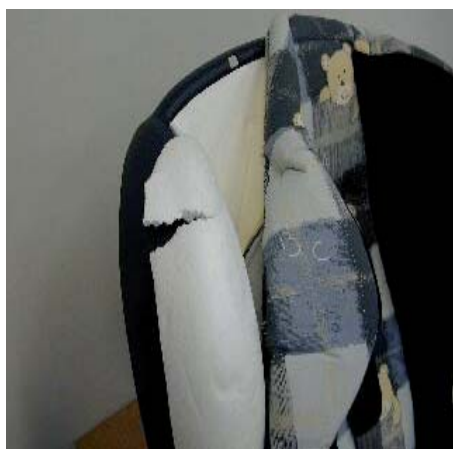
Coque intérieure cassée d'un siège d'enfant (déhoussé).

En Allemagne et en Autriche, il est interdit depuis avril 2008 d'utiliser des sièges d'enfants avec homologation 44.01 et 44.02. Cette interdiction s'applique à toute personne se trouvant dans ces pays. En Suisse, il est autorisé d'utiliser tous les sièges homologués ECE, règlement qui existe depuis 1981.