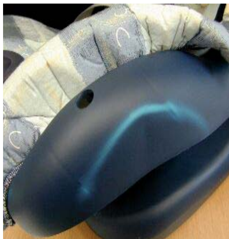
Trace blanchâtre de cassure sur la coque extérieure du siège.

La photo ci-dessous montre la coque extérieure avec une trace blanchâtre de cassure. Ces deux sièges ne doivent pas, indépendamment de leur âge, être réutilisés!