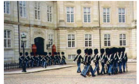
Il est 11h30, la garde s'apprête à défilier