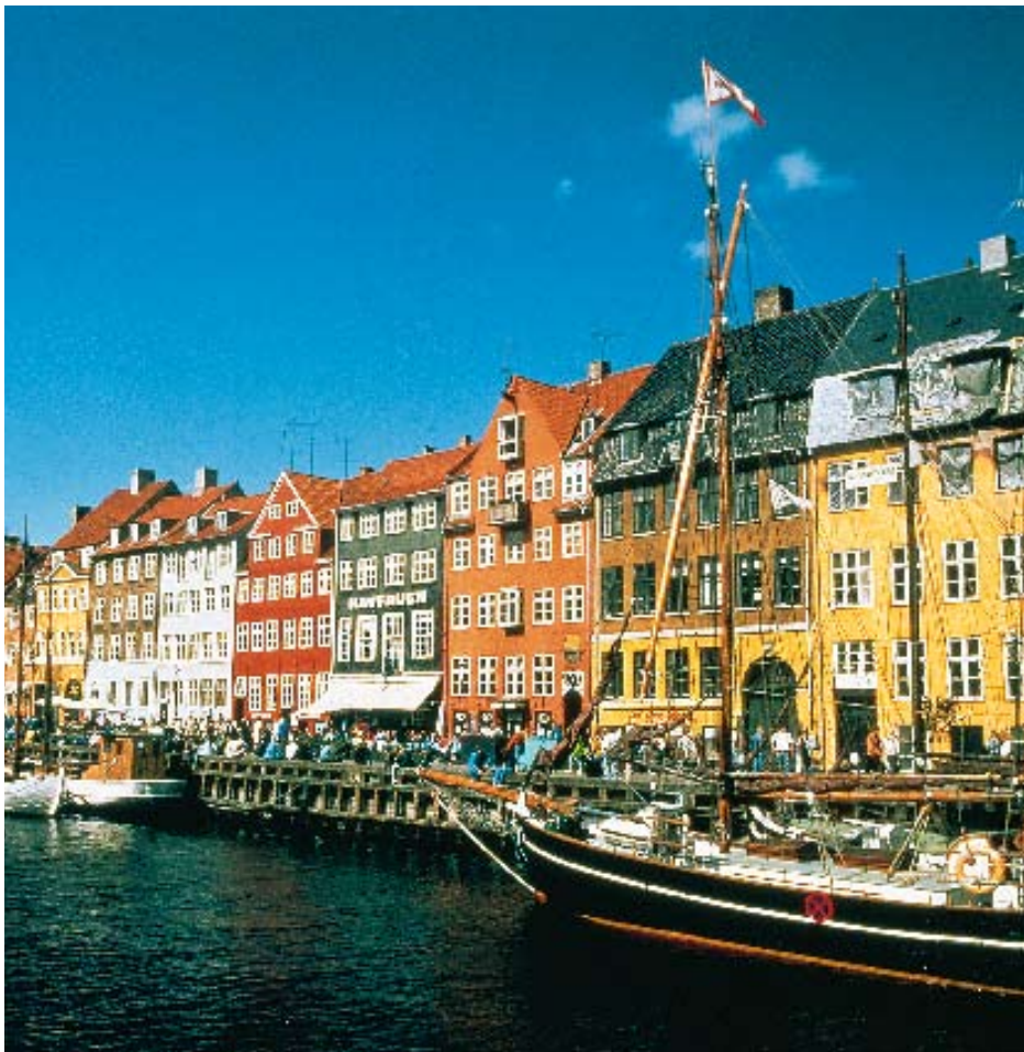
Découvrir Copenhague en navigant sur ses canaux est un must