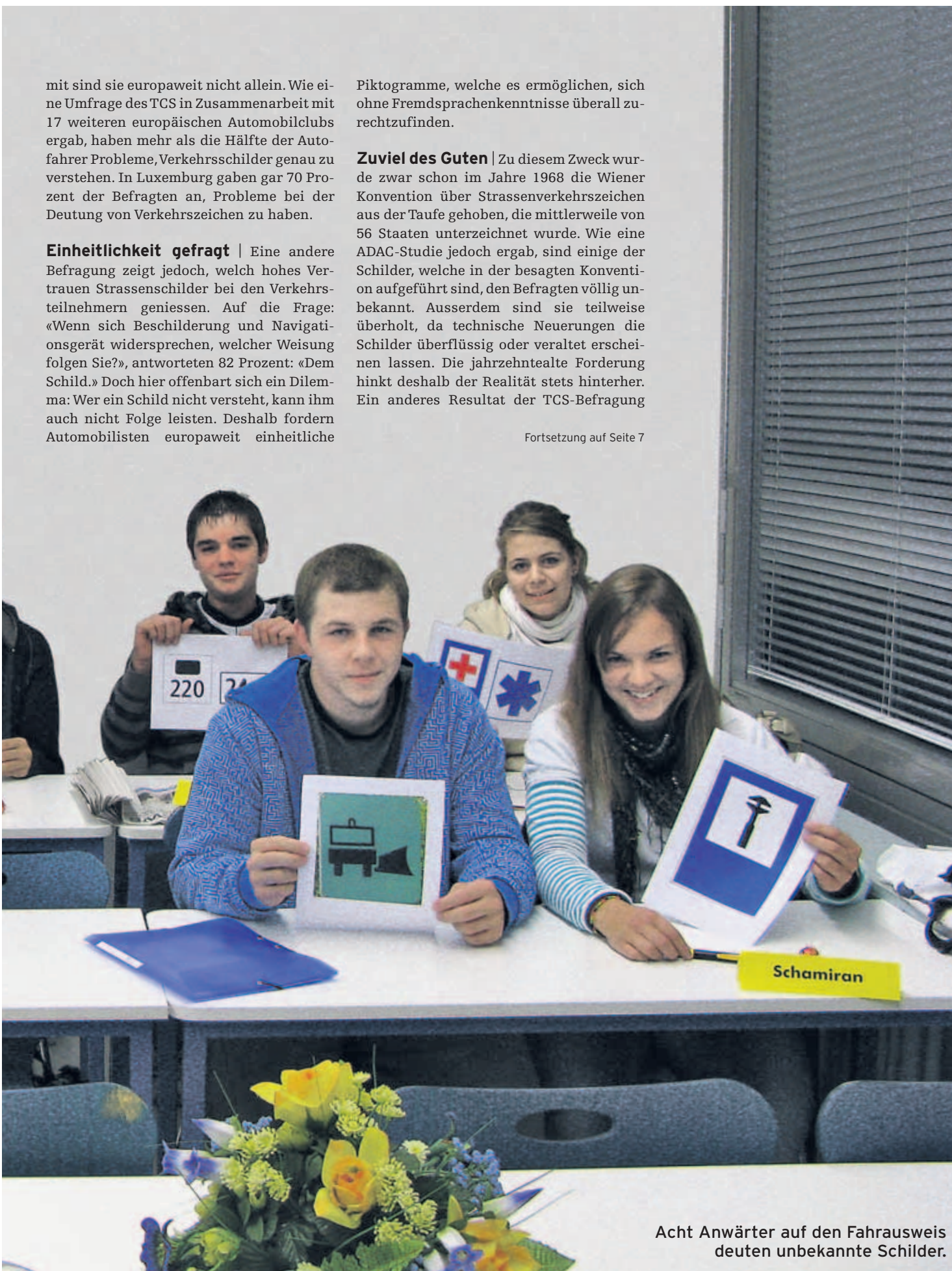
Acht Anwärter auf den Fahrausweis deuten unbekannte Schilder.