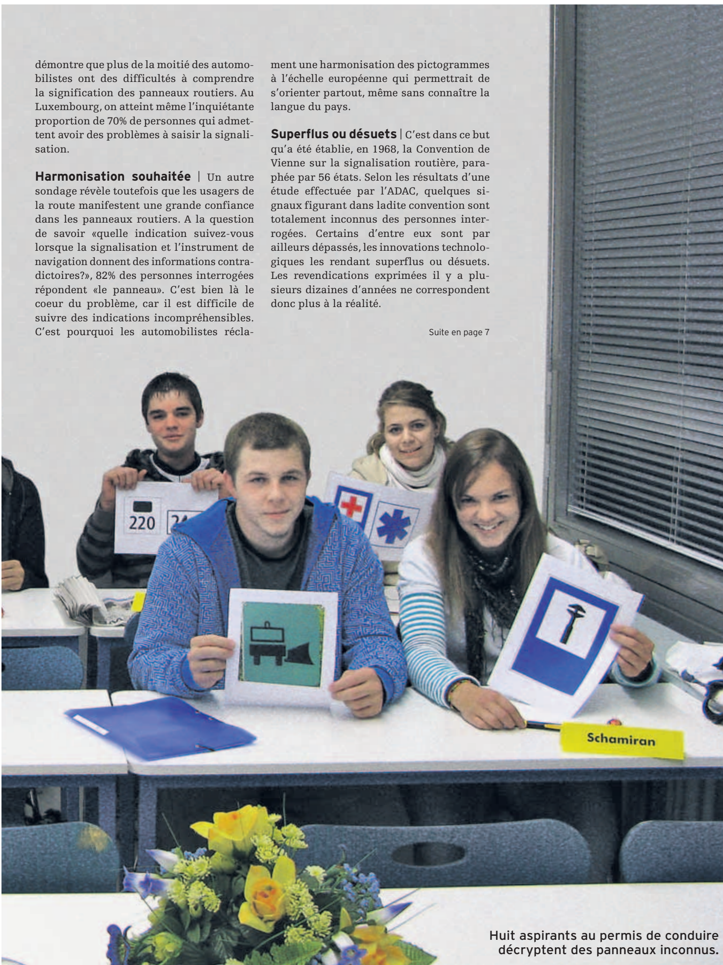
Huit aspirants au permis de conduire décryptent des panneaux inconnus.