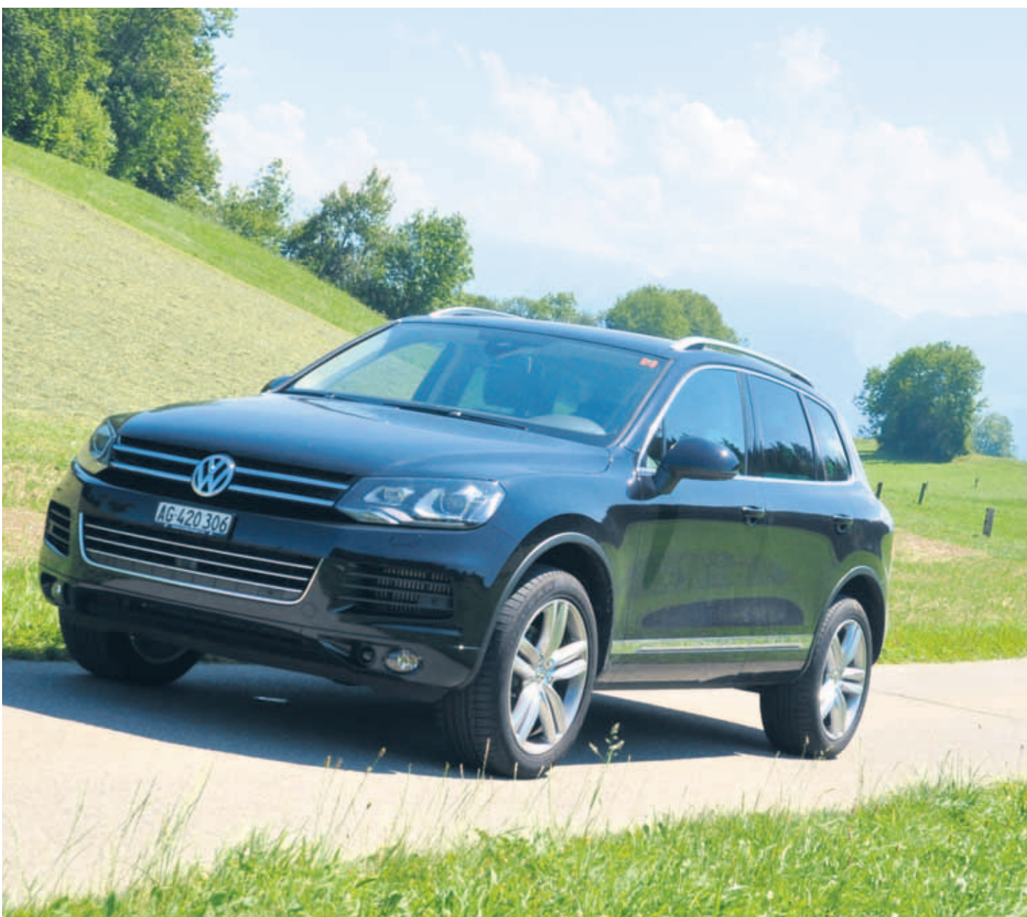
Malgré un gabarit en hausse, le VW Touareg de seconde génération a été allégé. Il se distingue par l'élégance de ses lignes.