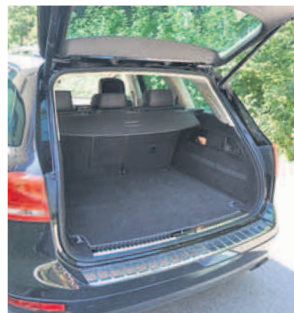
Le coffre a une capacité de 580 litres.