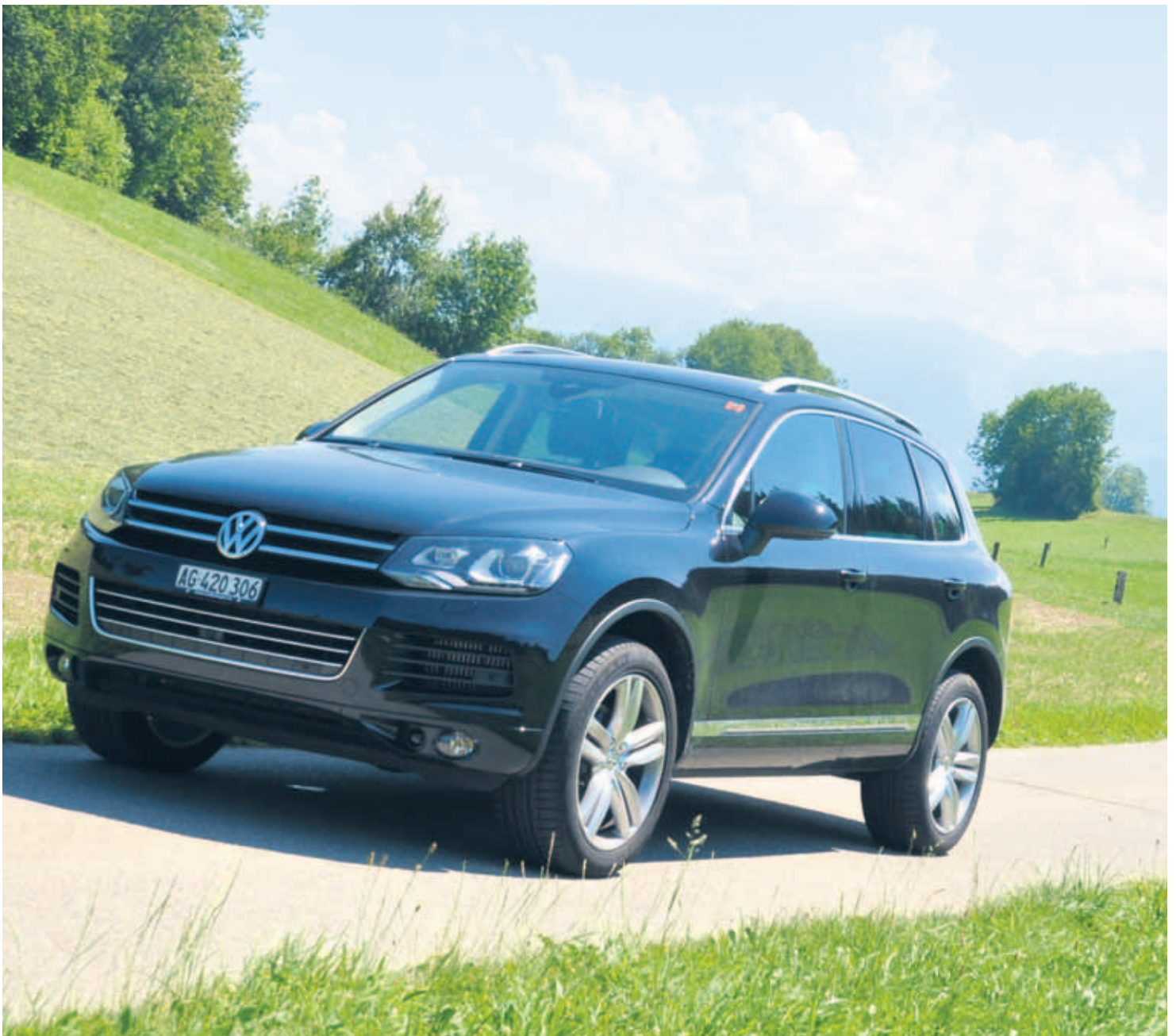
Trotz grosser Dimensionen ist der neue Touareg leichter geworden und besticht durch eine elegante Karosserie.