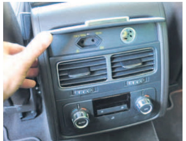
Der praktische 220 Volt-Stecker in der Mittelkonsole.