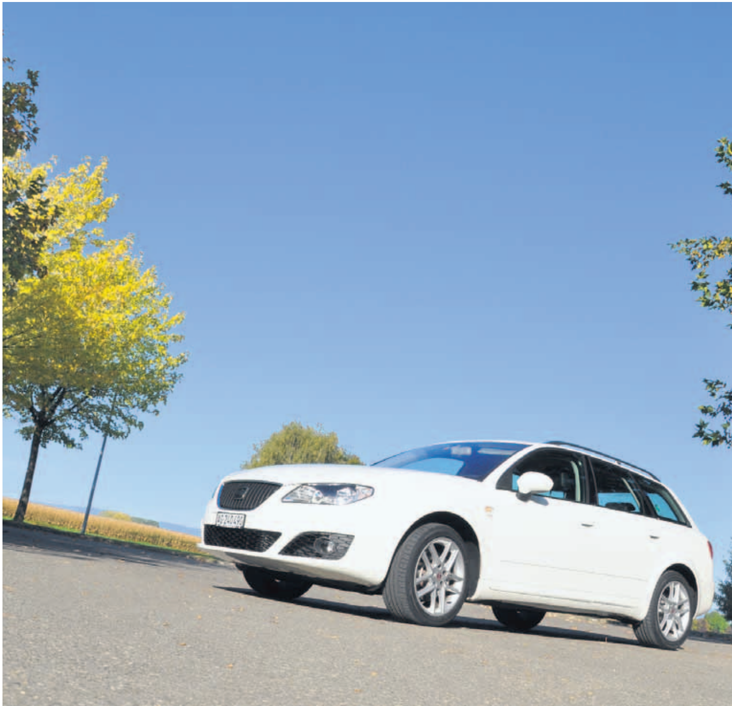
La break Seat Exeo ST lascia trasparire le sue origini Audi. Con una lunghezza di 4,67 m è una delle più compatte del segmento.