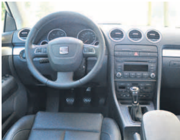
Ambiente sobrio e finiture serie sono di rigore.