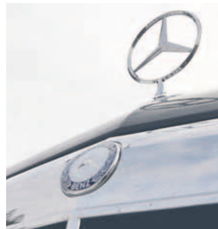
Una stella ancora simbolo di massima qualità.