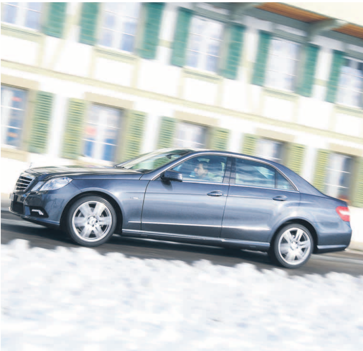
La berline Mercedes-Benz E 350 CDI est une somptueuse grande routière qui se distingue par son confort hors du commun.