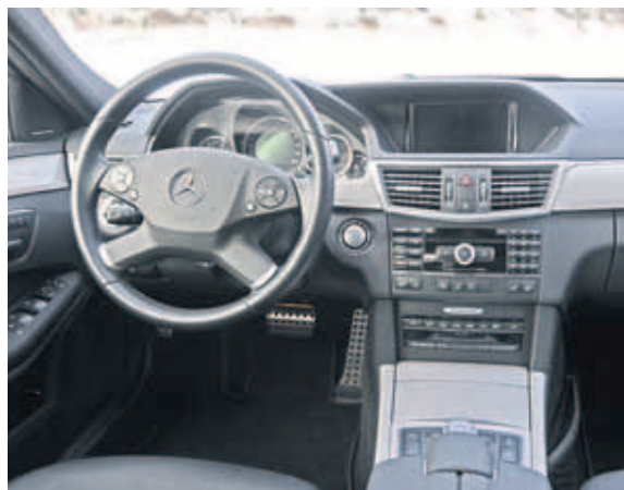
Das edel gestaltete Cockpit mit dem eher grossen Lenkrad.