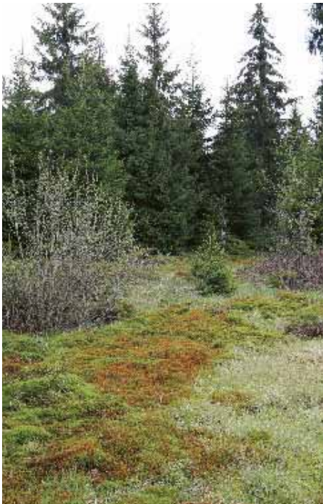
L'opération conjointe aura vraisemblablement lieu en novembre prochain.