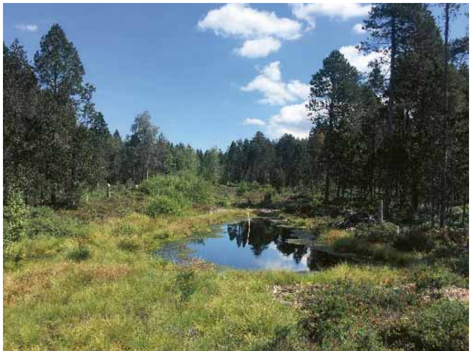
La revitalisation des tourbières vise à sauvegarder certaines plantes très menacées et, simultanément, à réduire les émissions de CO 2 .