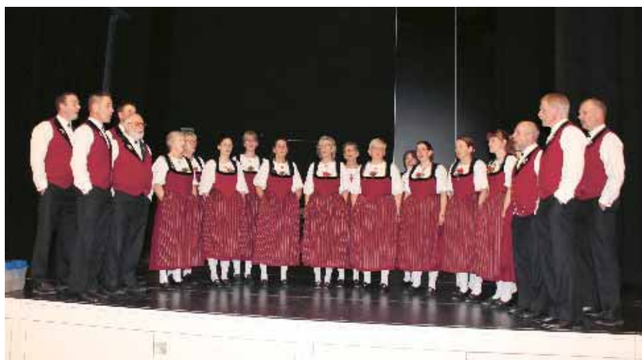
Le chœur mixte de jodleurs Anémone de Tramelan a ravi les convives.